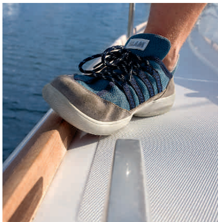
Sicher. Eine solide Teakleiste zieht sich als Fußreling ums ganze Schiff