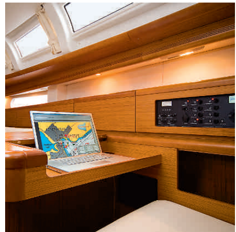
Zeitgemäß. In der Navi-Ecke kann ein Laptop im Extrafach untergebracht werden

Mit 195 041 Euro (Basisversion) ist die Sun Odyssey 44i ein äußerst attraktives Angebot, das Preis-Leistungs-Verhältnis stimmt. Die Verarbeitungsqualität im Detail und der Ausbaustandard erreicht gewiss nicht ganz das Niveau der hochpreisigen Konkurrenz, speziell aus Skandinavien. Das Gesamtpaket jedoch ist rund und marktgerecht, die Ausstattung gewissenhaft zusammengestellt. Und dank der neuen, gut gestaffelten Variationsmöglichkeiten wird die Kaufentscheidung jetzt noch einfacher.