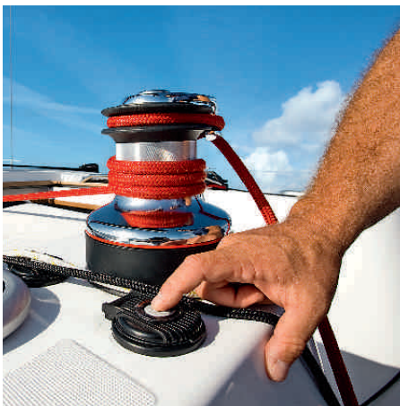
Empfehlenswert. Elektrische Antriebe für die Winschen sind ratsam