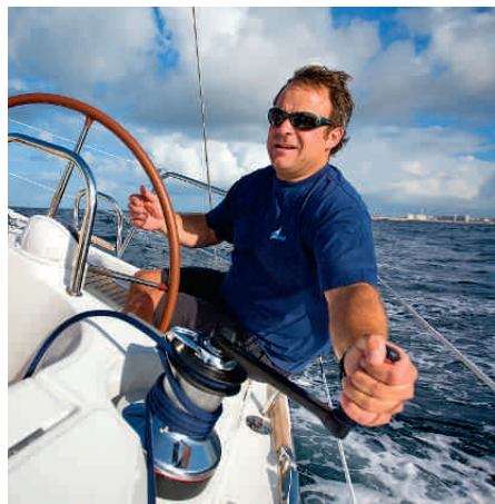
Mühsam. An der großen Schotwinde arbeitet man nur mit Schwierigkeiten