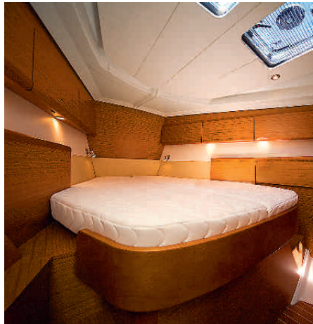
Gedrängt. Das Inselbett ist zwar schön, aber dennoch knapp in den Maßen

Besonders erwähnenswert ist das Stauraumangebot unter Deck. Zahlreiche Einbauschubladen sowie die Fächer in den durchlaufenden Sideboards stecken Kleidung und allerhand Kleinmaterial mühelos weg. Die lange Küchenzeile bietet ebenfalls jede Menge Platz. Weil die Tanks für Frischwasser und Diesel unter den Kojenbrettern vorn und achtern eingebaut sind, mangelt es auf der Sun Odyssey allerdings an groß-