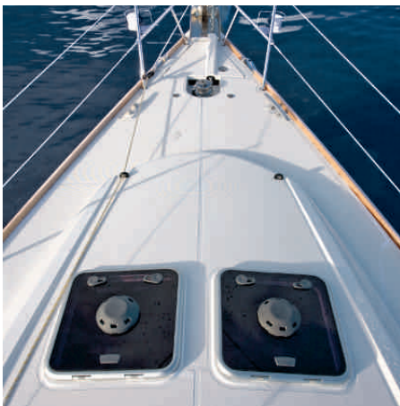
Unverbaut. Nur die Leine für die Rollanlage stört auf dem Vorschiff (Stolperfalle)

Um mit dem Angebot ein dementsprechend breites Spektrum abzudecken, hat