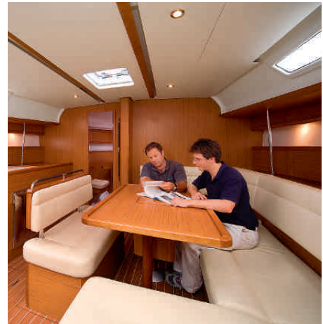
Variabel. Für den Salontisch stehen mehrere Varianten zur Verfügung

Bezüglich der Einordnung im Marktgefüge muss – wie immer bei Jeanneau – der direkte Vergleich mit den Produkten von Bavaria Yachtbau und Bénéteau bemüht werden. Dabei zeigt sich einmal mehr, dass Jeanneau trotz ihrer preiswerten Yachten die sehr offensive Preispolitik der Giebelstädter Werft zwar nicht ganz mitgehen kann, hinter Bavaria aber bei vergleichbarer Qualität die klare Position zwei im Kostengefüge des Marktsegments bezieht. Die Franzosen liegen damit vor Konkurrenzjachten zum Beispiel von Bénéteau (Océanis 46) und Dufour (455 Grand'Large).