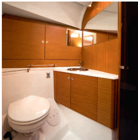
Angenehm. Das großzügig angelegte Bad vorn verfügt über viel Stauraum

volumigen Staumöglichkeiten für Kisten, Taschen und andere sperrige Gegenstände.