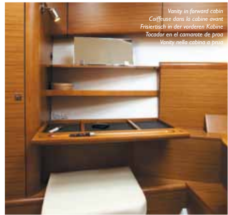
Vanity in forward cabin Coiffeuse dans la cabine avant Frisiertisch in der vorderen Kabine Tocador en el camarote de proa Vanity nella cabina a prua