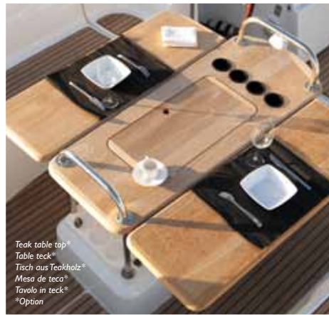
Teak table top* Table teck* Tisch aus Teakholz* Mesa de teaco* Tavolo in teck* *Option