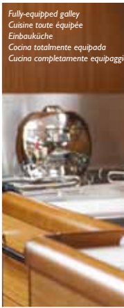
Fully-equipped galley Cuisine toute équipée Einbauküche Cocina totalmente equipada Cucina completamente equipaggiata