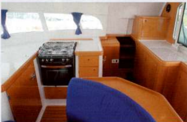
Blick vom Vorschiff nach achtern. Die Vorschiffskoje ist gut bemessen, die längs angeordnete Nasszelle ebenfalls