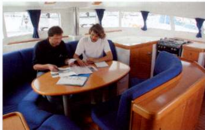
Der große Salon mit Panorama-Blick bietet Platz für bis zu acht Personen am Tisch. Hier sollte auch die Kartenarbeit stattfinden

In der Pflicht steht die Crew unter einem sehr solide ausgeführten Bimini; im Gestänge findet sich ausreichend Halt bei ruppigen Bewegungen – allerdings muss man 1,90 Meter hoch gewachsen sein, um das