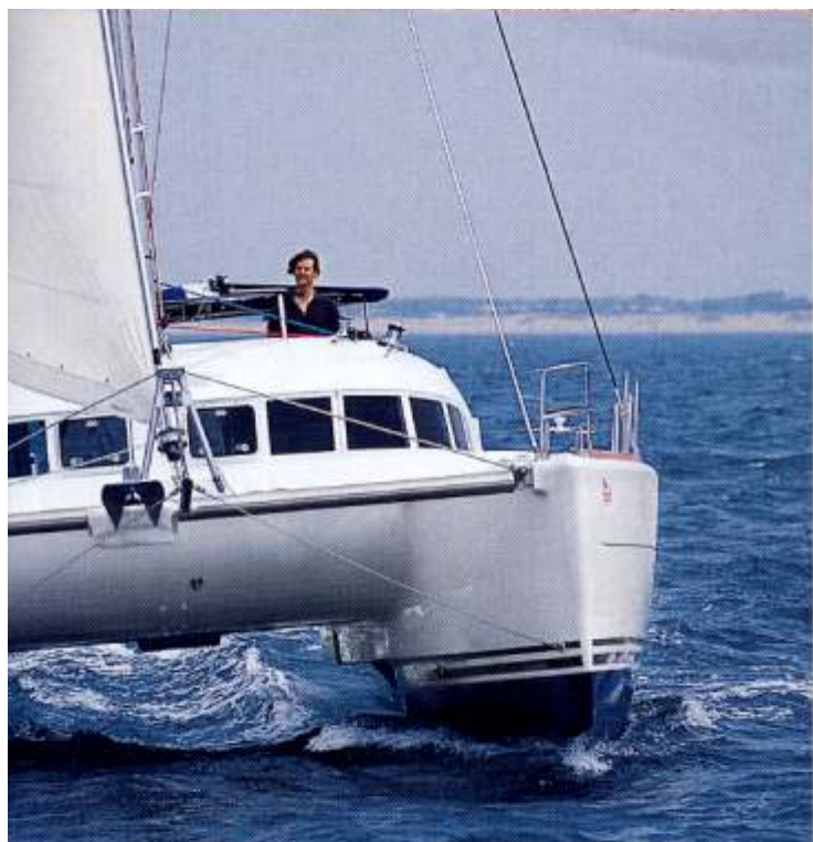
Kat in voller Fahrt: Über zehn Knoten laufen wir in der Spitze, bei geringster Krängung

Gestänge zu erreichen. Sehr gelungen ist der Steuerstand, auch bei schwerem Wetter sitzt der Rudergänger hier sicher und gut abgestützt. Alle Instrumente sind gut ablesbar und erreichbar – bei der Größe manches Kat-Steuerstandes ist das nicht selbstverständlich.